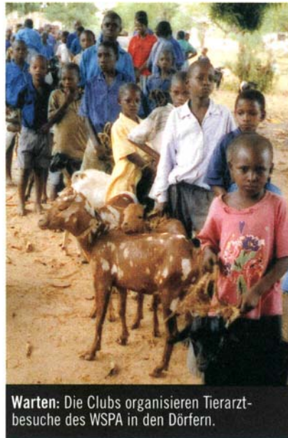
Warten: Die Clubs organisieren Tierarztbesuche des WSPA in den Dörfern.

Begeistert machen viele Jugendliche mit und tauschen über ihre Zeitschrift Ideen und Erfahrungen aus. Die Mitglieder des Antilopen Kindness Club von Sefwi-Wiawso in Ghana berichteten zum Beispiel, dass sie in den letzten Wochen in