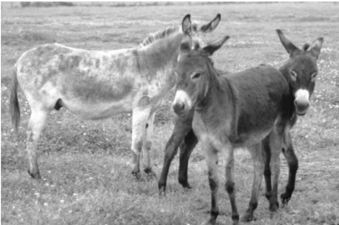
Abb. 1: Eine Vielzahl verschiedener „Eseltypen“ und Farbvarianten kann in Deutschland angetroffen werden.

Durch die vielfältigen Einflüsse auf die Zucht haben sich große Unterschiede bei den einzelnen Linien ergeben. Die meisten Esel haben ein Stockmaß zwischen 95 bis 115 cm. Für Grossesel wie den Baudet du Poitou ist ein Stockmaß von 140 bis 150 cm (Hengste) im Zuchtstandard festgeschrieben.