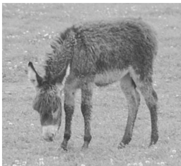
Abb. 6: Das flauschige Fohlenfell saugt sich wie ein Schlamm voll Wasser, wenn das Fohlen nass wird. Leicht kann eine lebensbedrohliche Lungenentzündung die Folge sein.

Werden die Tiere bei andauernd feuchtkalter Witterung mehrtägig auf der Weide gehalten, ohne eine Möglichkeit für die Tiere einen Stall aufzusuchen, so gelten für den Witterungsschutz die Stallmaße, damit sich alle Tiere niederlegen können.