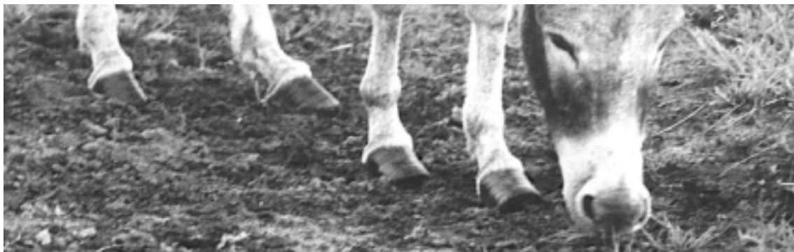
Abb. 5: Fütterungsfehler, mangelnde Hufpflege und anhaltende Feuchtigkeit am Boden schaden Hufen und Gelenken und können den Esel das Leben kosten.

Für kranke Tiere und fohlende Stuten muss eine separate Unterbringungsmöglichkeit vorhanden sein (z. B. eine Krankenbox), die den oben genannten Anforderungen an einen Stall genügt. Kranke Tiere sollten Sicht- und Geruchskontakt mit den anderen Tieren behalten, um die spätere Wiedereingliederung zu erleichtern. Für Zuchtherden gilt ausserdem, dass eine Absonderungsmöglichkeit für den Hengst vorgehalten werden sollte, um ungewollten Paarungen und Aggressionen in der Herde wirksam begegnen zu können (s. Kapitel zu Guppen- / Einzelhaltung).