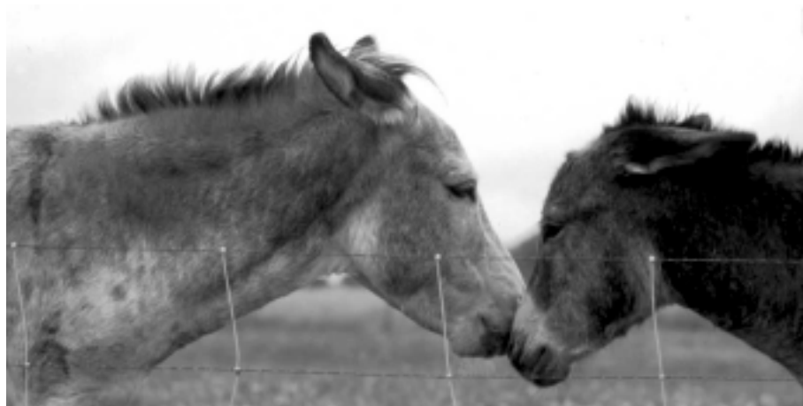
Abb. 2: Esel zeigen eine auffällige Mimik und Körpersprache

In Eselhaltungen bilden nicht zur Zucht verwendete Stuten und Wallache nach Möglichkeit innerhalb einer Gruppe feste, langjährige "Freundschaften". Bleiben mehrere Hengste bei einer Herde, muß mit Beschädigungsverhalten zwischen den Hengsten und teilweise blutigen Auseinandersetzungen gerechnet werden, wenn keine hinreichenden Ausweichmöglichkeiten bestehen. Es wird auch über ausgeprägt aggressives Verhalten von Hengsten gegenüber Stuten berichtet, wenn die Hengste nur sehr wenige Stuten (2-3) führen. Allgemein kann gesagt werden, dass es unter stark eingeschränkten Haltungsbedingungen (insbesondere bei mangelndem Platzangebot) mitunter zu schwereren Bissverletzungen zwischen den Eseln kommt, gerade auch wenn weitere Tiere in die Herde eingegliedert werden sollen. Ausweichmöglichkeiten und ein großzügiges Platzangebot können dem vorbeugen. Reine Hengstgruppen können erfahrungsgemäß nicht gehalten werden.